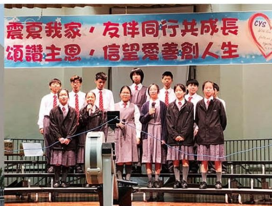
中一級學生參與孝親歌唱比賽